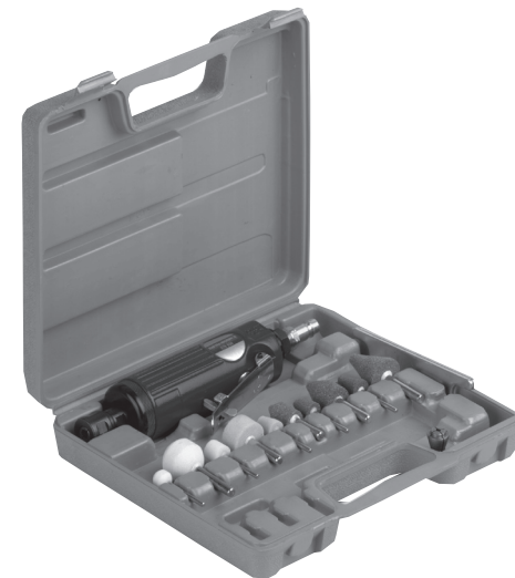
Stopková bruska STS 630 set, STS 7000