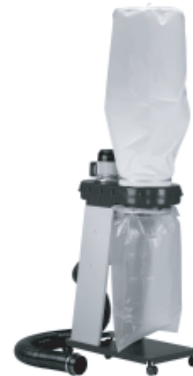
Odsávací zařízení SPA 1101